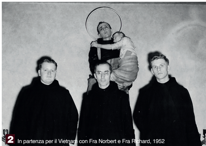
2 In partenza per il Vietnam con Fra Norbert e Fra Richard, 1952

Consumato dalla carità, a causa di una complicazione cardiaca spirò santamente fra le braccia di un Confratello il 28 febbraio 1972 nell'Ospedale di Saigon. Nel 1999 fu avviata la Causa di Canonizzazione; il 14 dicembre 2015 il Sommo Pontefice Papa Francesco ne riconobbe le virtù eroiche proclamandone la Venerabilità.