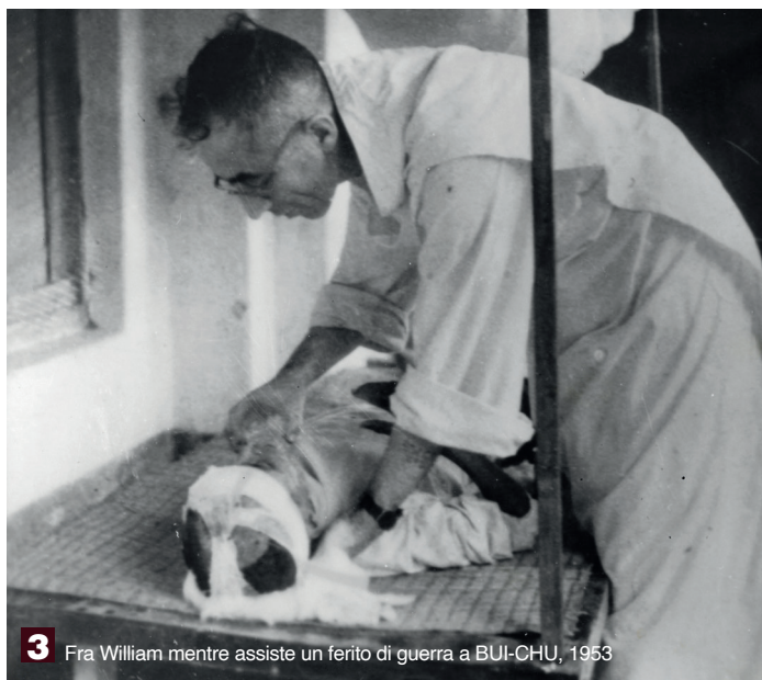
3 Fra William mentre assiste un ferito di guerra a BUI-CHU, 1953

Consumato dalla carità, a causa di una complicazione cardiaca spirò santamente fra le braccia di un Confratello il 28 febbraio 1972 nell'Ospedale di Saigon. Nel 1999 fu avviata la Causa di Canonizzazione; il 14 dicembre 2015 il Sommo Pontefice Papa Francesco ne riconobbe le virtù eroiche proclamandone la Venerabilità.